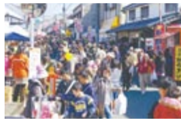
多くの人でにぎわう赤間宿通り(昨年の様子)