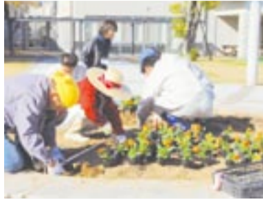
花の苗を植えるサポーターら

「市民活動交流館（メイトム宗像）の花壇に花をいっぱい咲かせましょう」を合い言葉に集まった10人の「花壇づくりサポーター」が昨年11月19日と同24日、花壇に花の苗を植えました。