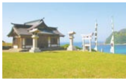
拜殿のような役割を果たす沖津宮遷拜所

「宗像・沖ノ島と関連遺産群」が世界遺産となつたらどうなるのでしょうか。いつでも沖ノ島へ行けるようになるわけではありませ