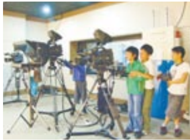
マルチメディア講義室で撮影をする子どもたち

慶尚南道が2億ウォン、金海市が1億ウォンの合計3億ウォン(約2,178万円)を投入して完成した「こども映像文化館」は、先端映像・体験・上映設備を整え、壁面にLED電光板とタッチスクリーンを設置するなど、誰でも簡単に映像文化に接することができます。