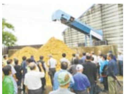
工場見学で、生産された製紙用の竹チップの説明を受ける参加者たち

初日は、県内外から約170人が参加。基調講演や活動発表、パネルディスカッションに参加者らは熱心に耳を傾けていました。そのほか、竹林オーナー制度や竹パウダーを使ったダンボールコンポストの展示、水鉄砲や竹とんぼづくり教室など、多くの人でにぎわいました。