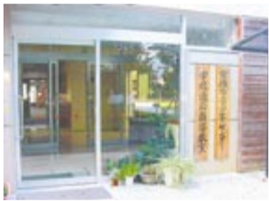
青少年センター内にある学校適応指導教室

学校適応指導教室（適応教室）は、心の問題などが原因で学校に行きたくても行けない児童・生徒が、小・中学校へ復帰できるように支援する場所です。