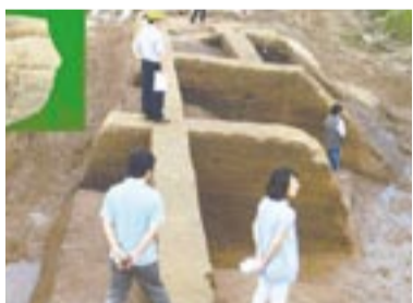
翰林面匙山里の文化財発掘現場

金海市と慶南文化財研究院は最近、市内翰林面匙山里(ハルリムミョンシサルリ)一帯の文化財発掘調査で、金海市で初めて新石器時代初期の隆起文土器を発掘しました。