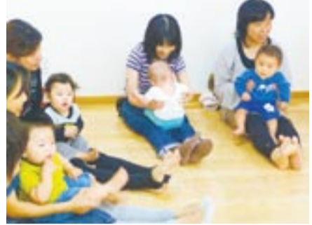
えほんのへやで開催しているわらべうたでの親子遊び

わらべうたで子どもと遊んだことはありますか。 わらべうたは、育児中のお母さんやお父さんが、穏やかに子どもと向き合う方法の一つとして、昔から受け継がれてきました。 市民活動交流館(メイトム宗像)・えほんのへやのおはなし会では、絵本や紙芝居の読み聞かせのほかに、わらべうたで親子遊びをしています。子どもたちの楽しそうな笑顔を見て、「家でもやってみたい」という人がたくさんいます。 図書館の本を見ながら、家でゆっくり遊んでみましょう。