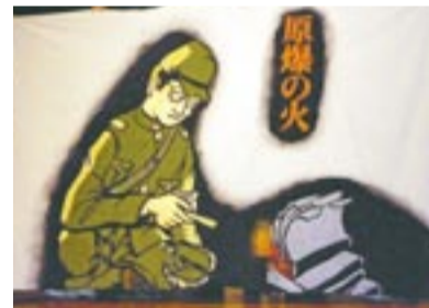
布しばい「原爆の火」