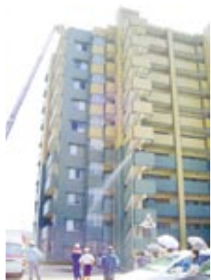
屋上の避難者を救助するはしご車を見守る参加者ら

訓練の最後は、子どもたちも交えて消火器の操作実習。消防署員から「消火器1本は16秒しかもたない」と説明を受けて、驚きの声が上がっていました。