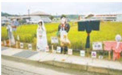
力作ぞろいのかかしコンクール(昨年)

内容 ▽猿回し、バナナのたたき売り、南京玉すだれ、ガマの油売りなど ▽あなたの1票が優秀作品を決める「かかしコンクール」 ▽枝豆狩り(1束200円) ▽もちまき(①午後1時②同4時20分)