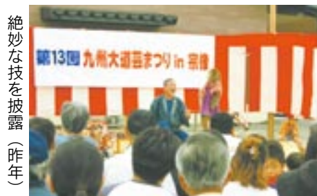
絶妙な技を披露(昨年)

*小雨決行 会場 原町唐津街道(国道3号線「光岡」交差点南方向約200メートル)