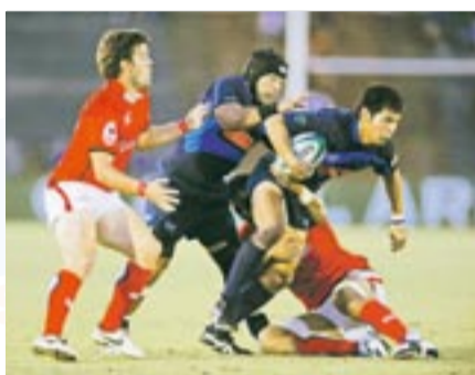
勝利に向かって懸命にプレーするブルースに熱い声援をお願いします