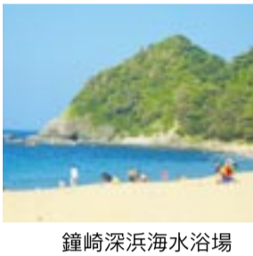
鐘崎深浜海水浴場

ワ1設備が整った観光休憩所があります。 施設 ●シャワー 200円 ▼トイレあり ▼更衣室 大人600円、子ども400円 ■問い合わせ先 おおしま観光案内所 ☎(72)2226