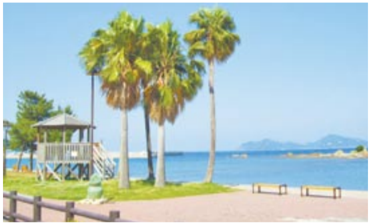
大島かんす海水浴場

おすすめ② 鐘崎深浜海水浴場 天気の良い日は沖ノ島が見渡せる風光明媚(めいび)な海水浴場です。ボードウォークが約1キロメートルに渡って整備され、海水浴だけではなく、年間を通して散策にも気持ちがいい場所です。