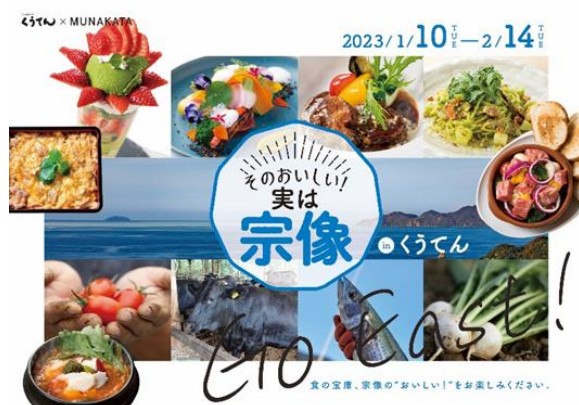
フェア メインビジュアル