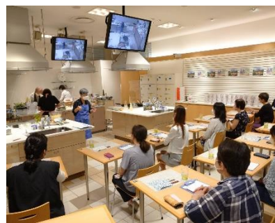
過去に実施した料理教室の様子