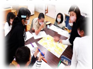
地島のよさ見つけ（4月）

今年度も、地域や保護者の皆様に支えられながら、地島の人・自然・文化・くらしに直接ふれ、自分の生き方を考える体験活動を継続してまいります。