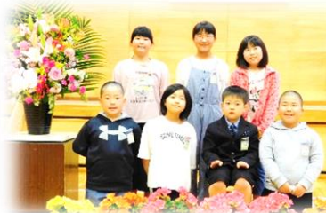
令和3年度入学式にて