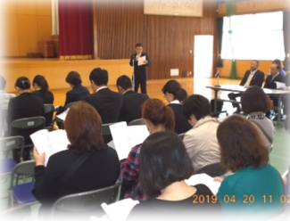
4/20 PTA 総会