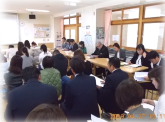
4/27 PTA 総会