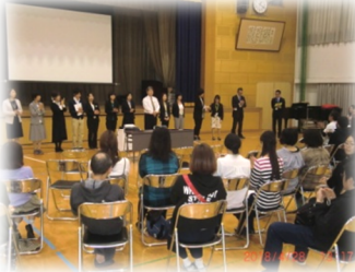
4/27 PTA 総会