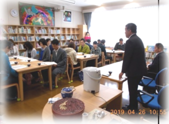
4/26 PTA 総会