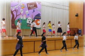
「夢プロジェクト」城東高校ダンス部による演技