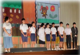
9年生劇「開拓村のかあさんへ」

10月15日（土）、玄海中学校で文化祭が開催されました。今年のスローガンは《Story～ここでしか作れない物語を～》とし、午前中は9年生の劇やステージ発表、各学年の合唱等が行われ、午後からは「夢プロジェクト」城東高校ダンス部によるすばらしい演技が披露されるなど、生徒達にとって、とても有意義な1日となりました。