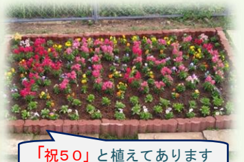
「祝50」と植えてあります