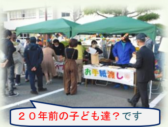
20年前の子ども達？です