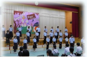
7年生合唱「マイパレード」