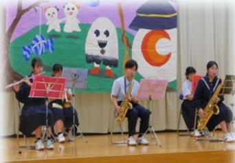
吹奏楽部による演奏「The fox」他