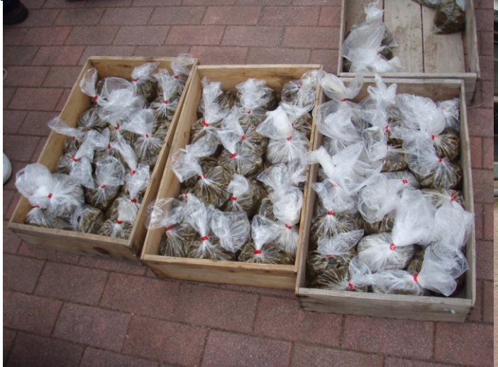
地域の皆さん、ご協力ありがとうございました。