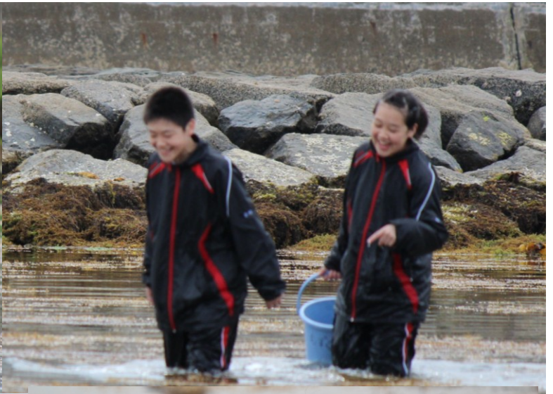
普通に女子でもヒトデやなまこを触れます。