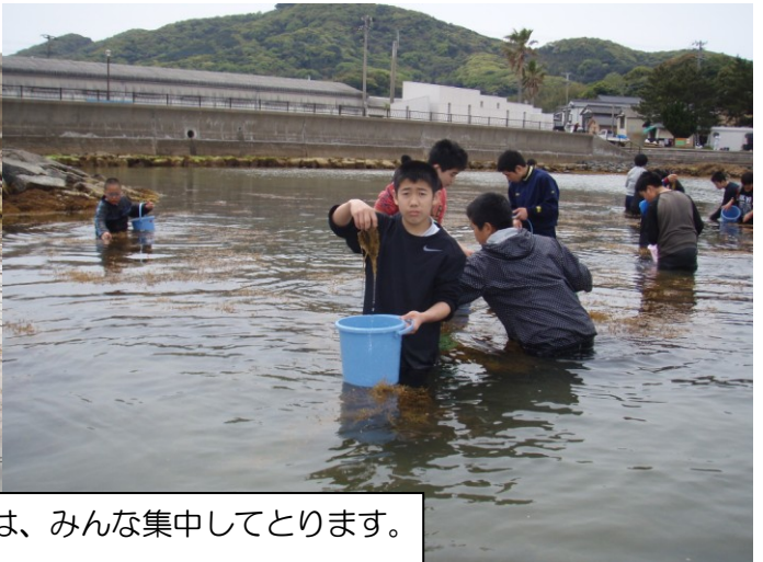
はじめは、みんな集中してとります。