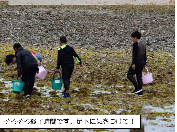
そろそろ終了時間です。足下に気をつけて！