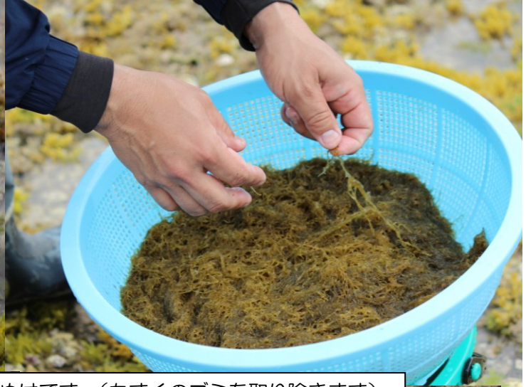
全員でもぬけです。(もずくのごみを取り除きます)