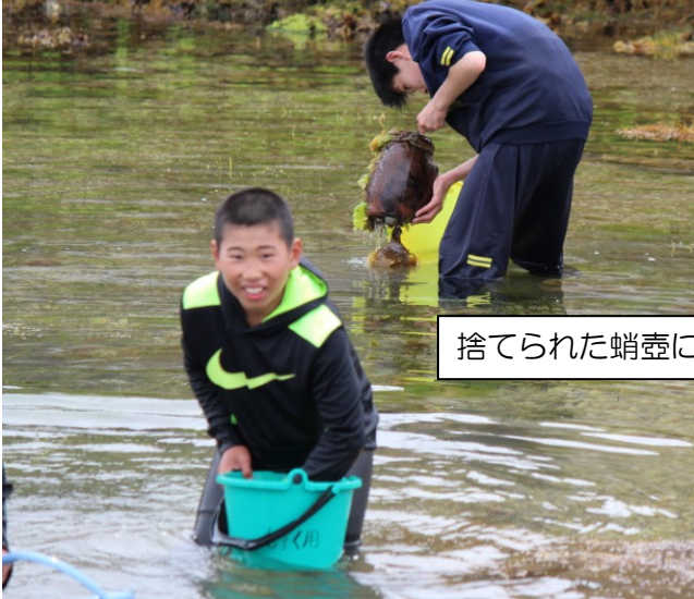
捨てられた蛸壺にタコ発見！