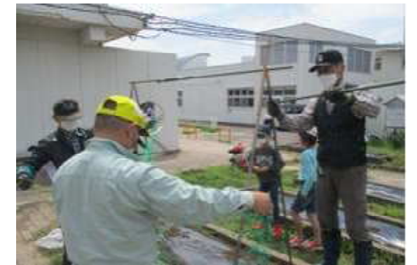
【河東小での生活科の様子】

5月12日(金)に河東小2年生が、生活科「大きく育てわたしの夏野菜」で、河東地区の地域ボランティアの方々から、夏野菜の植え方を教えていただきました。野菜を育てることを通して、育つ場所や変化、世話の仕方を調べたり、野菜名人の方に聞いたりしながら愛着をもって世話をすること、育てたり収穫したりしたことをまとめ、お世話になった野菜名人の方に伝えることが学習内容です。収穫が楽しみです。地域ボランティアの皆様、ありがとうございました。