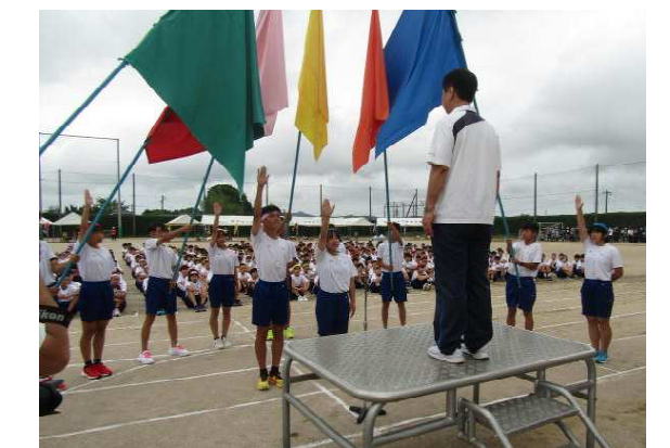
【河東中体育祭の様子】