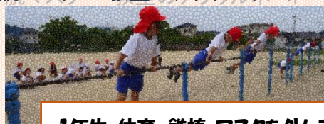
1年生 体育 鉄棒 マスクを外して

なお、お子様がマスクやボードを外すことを不安に思っていることもあります。その時は、担任と保護者様とで確認・相談しながら柔軟に対応していきたいと考えております。個別に担任までご相談ください。