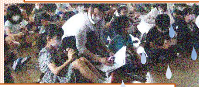
3年生 音楽 リコーダー学習