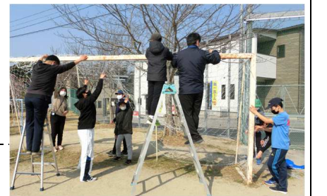
【活躍する南郷小サポーター】

登録後、最初の活動となったのは、南郷小のサッカーゴールの整備です。古くなって破れていたゴールネットを張り替え、きちんと固定する作業です。3月9日の放課後、20分程度の作業でしたが、23名の会員が参加し、活動を楽しむ姿がみられました。きれいになったサッカーゴールを見て、満足そうな笑みを浮かべ、学校としても感謝、感謝のひとつとなりました。参加してくれたみなさんありがとうございました。