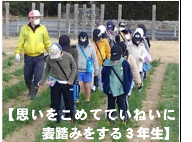
【思いをこめていないに 麦踏みをする3年生】