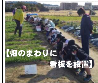
【畑のまわりに 看板を設置】

使用する指示棒のことです。本体が麦わらでできていることから、いせきんぐ宗像の畑を借りて小麦を育てています。11月に撒いた種が芽を出し、10cm程に育ったので上から踏んで根を強くします。いわゆる「麦踏み」です。子供たちにとっては、初めての経験で、交代しながら丁寧に踏んでいました。今後は、5月に刈って乾燥させ、赤い布袋に詰めて完成となります。出来上がったものは、山笠振興会の方に渡して、今年の山笠で使っていただくようになります。