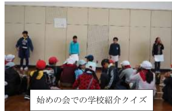
始めの会での学校紹介クイズ

10月17日(木)から18日(金)に、5年生が玄海少年自然の家で宿泊体験学習を行いました。1日目に、吉武小・赤間西小との小小交流で『スコアオリエンテーリング』を行いました。3校の子どもたちが中学校になった時仲良くなることを目的に行いましたが、本校の5年生は、事前の準備や司会、進行を中心に行い、この活動を通して大変逞しく成長したと思います。