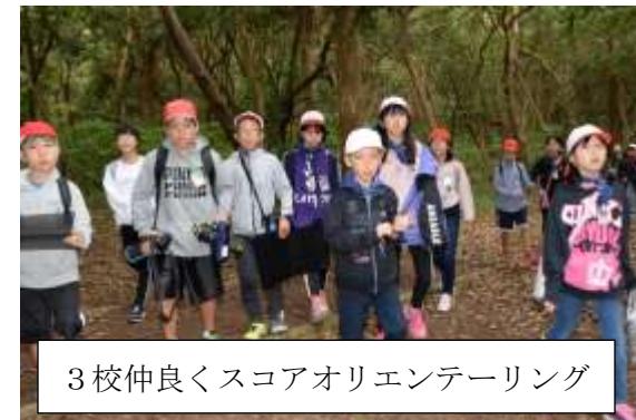
3校仲良くスコアオリエンテーリング