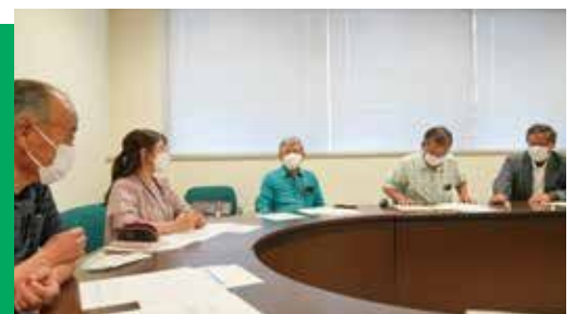
コミュニティ運営協議会の会議