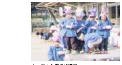
上・下とも玄海幼稚園