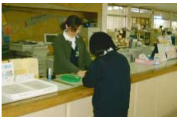
上/玄海町役場住民福祉課窓口 下/宗像市役所市民課窓口

今回は、住民の皆さんがよく利用される窓口での事務手数料について、両市町の現状をご紹介します。